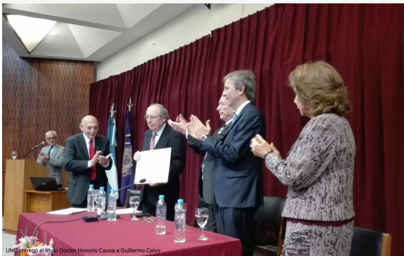
UNC entregó el título Doctor Honoris Causa a Guillermo Calvo

El prestigioso economista fue el encargado de dar inicio a las 50 o Jornadas Internacionales de Finanzas Públicas y recibió la máxima distinción honorífica de la Universidad Nacional de Córdoba.